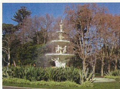
フィッツロイ庭園